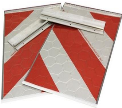
1 x links / 1 x rechts

Warnflaggen-Set für Hebebühnen links + rechts, 450 x 250mm rot/grau inkl. 2 Kunststoffhalterungen