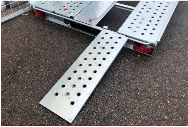
Rampen hinten verschiebbar (ausser bei L-AT 350)