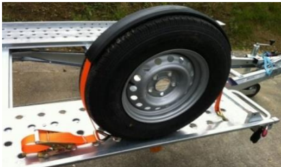
Zurrgurt mit Gummiband