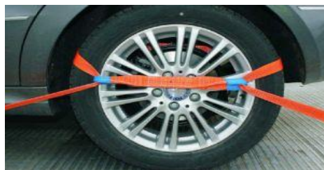
Zurrgut 3-teilig um Rad