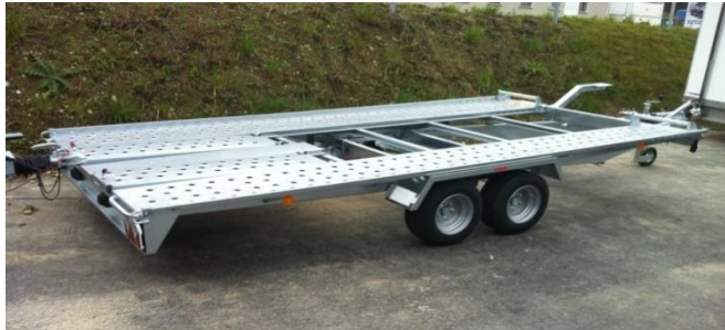
L-AT 400 T-KI GG 2600kg