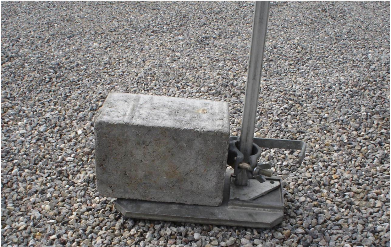
Fussplatten und Gewichte zur Sicherung montieren