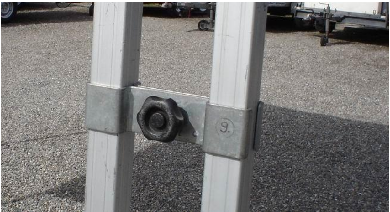
Klammer zum verbinden von zwei Zelten