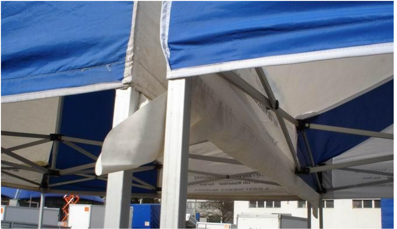
Regenrinne zwischen zwei Zelte