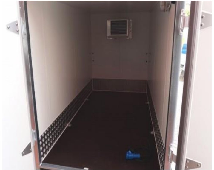
Standart: Holzboden mit Alu-Scheuerleisten