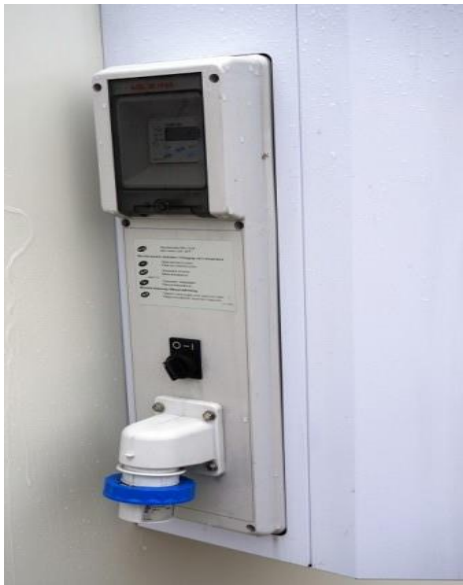
Kühlaggregat / Bedienung