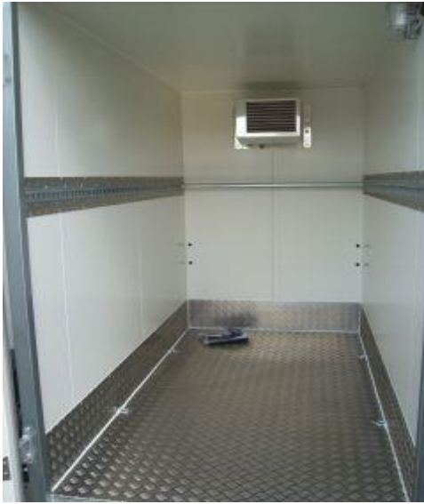
Isoboden mit Aluriffelblech