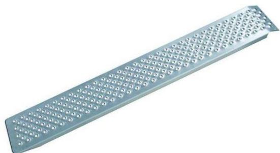
Auffahrrampen mit Lochprofil 150 x 21cm 400kg Traglast/Paar Nr. 65497 Paar Fr. 135.00