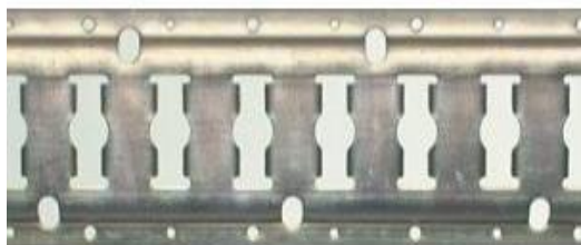
Loch-Schlitz Bindschiene Stahl verzinkt 3m Länge Nr. 58100 Fr. 48.00

Anhänger Möbel-Lifte Hebebühnen Zelte Gas Vermietung-Verkauf-Reparaturen