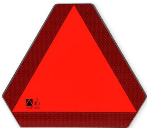
Warndreieck für langes Fahrzeuge Reflektierend 40 x 35cm Nr. 58340 Fr. 28.—