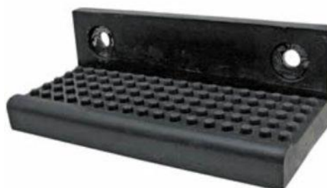
Tritt mit Gummibelag zum anschrauben 20 x 9cm Nr. 55403 Fr. 38.—