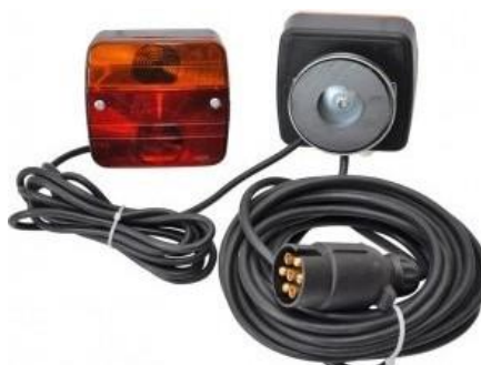
Lampensatz 12 Volt mit Magnet, Kabellänge 7.5m Zwischenkabel 2,5m Nr. 54516 Fr. 52.—