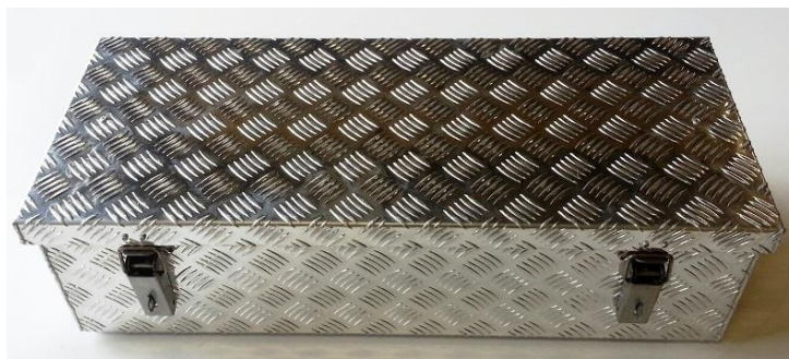
Alubox Länge 80cm, Tiefe 30cm, Höhe 19cm 2 Verschlüsse für Vorhängeschloss Nr. 57154 Fr. 155.—