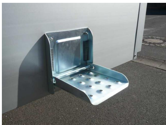
Klaptritt verzinkt 150 x 160mm Nr. 55401 Fr. 23.—