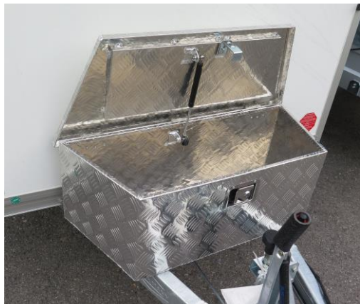
Alubox Breitenmass hinten 89cm, Höhe 32cm Abschliessbar Nr. 57088 Fr. 198.—