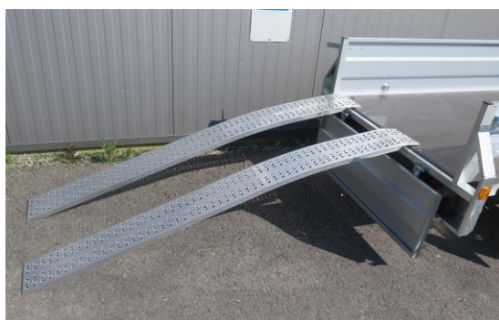
Auffahrrampen gebogen, mit Lochprofil 200 x 31cm max. 1000kg Traglast/Paar Nr. 65535 Paar Fr. 290.—

Verkaufsladen mit über 2000 Anhängerteile, über 50 Werkzeugboxen, über 150 Auffahrrampen