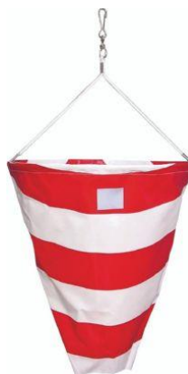
Warnsignal für Überlängen, reflektierend Länge 38cm, Durchmesser 38cm Nr. 55870 Fr. 60.—