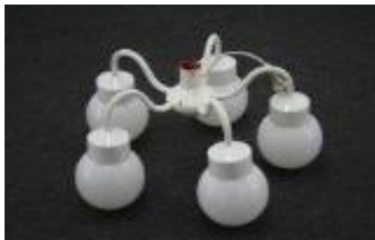
Hängeleuchte mit 5 weissen Kugeln à 60 Watt, 220 Volt Miet-Lift Art. Nr. 13108