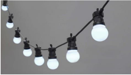
Lichtkette 10m, 230 Volt mit weissen Glühbirnen mit matten oder klaren Glühbirnen Miet-Lift Art. Nr. 13100