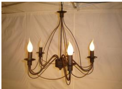
Hänge-Kerzenleuchter mit 5 Kerzenbirnen, 220 Volt Miet-Lift Art. Nr. 13109