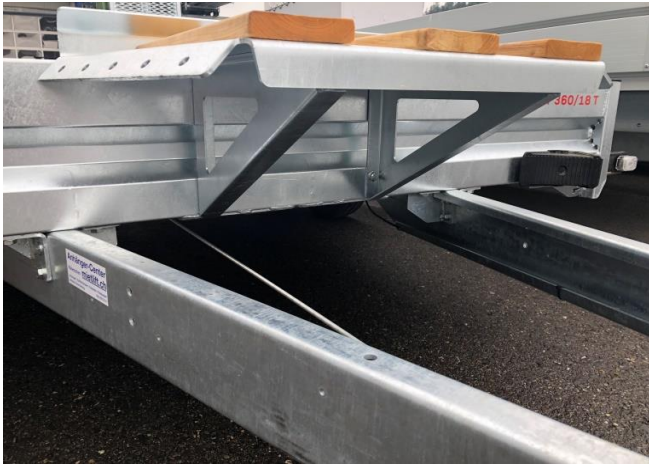
Schaufelablage über Deichsel